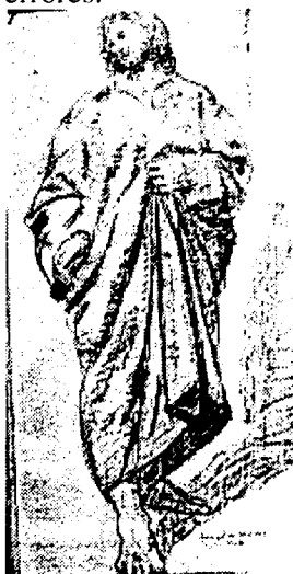
F. 3- Apunte de una de las vistas para la realización de una escultura, por Juan González Moreno