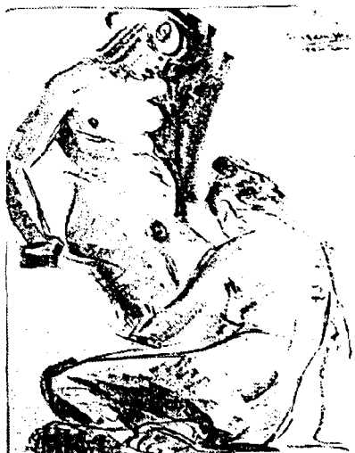
F. 4- Boceto realizado por el escultor Juan González Moreno

En la descripción, paso a paso, de su método, que utilizaba como regla básica, se seguía con el sombreado , el modelado del volumen , ya que el dibujo realizado sólo con líneas no solía ser suficiente para definir el volumen de lo representado. Según ilustraba, para modelar las formas, en el dibujo, el sombreado constituía el recurso más utilizado, así como una de las fases que más tiempo solía ocupar en las etapas de aprendizaje. Con cada una de las técnicas y materiales de dibujo, se utilizaban diferentes modos de construir y aplicar las sombras: rayados de distintos tipos, punteados, difuminados, etc..., experiencias visibles para poder deducir la naturaleza de los objetos por las luces, o la distribución de luces y sombras. Así es como él consideraba que debía proceder el principiante, encontrando los signos gráficos que querían alcanzar al experimentar un pequeño repertorio.