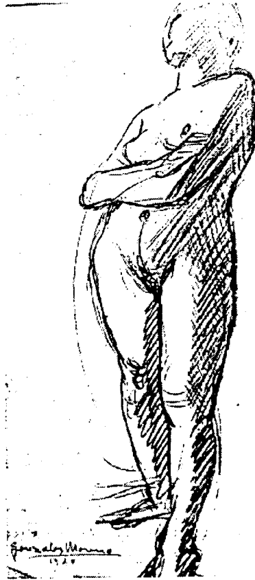
F. 5- Boceto realizado por el escultor Juan González Moreno

nes en todas las Escuelas de Arte, con el criterio de eliminar así el problema del color, que se aplazaba para resolverlo en otras etapas posteriores. Con estas figuras conseguía, a la vez y utilizando un foco adecuado de luz, obtener grandes contrastes de claroscuro y posibilitar a sus alumnos, estudiar diferentes tipos de iluminación.