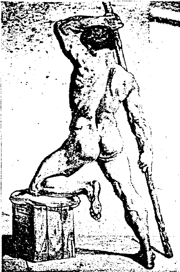
F. 2- Dibujo realizado por el escultor Juan González Moreno

Se comenzará así con el proceso: En primer lugar, se debía empezar con un aprendizaje mediante la copia de láminas, generalmente extraídas de las cartillas , método de dibujo usado en las primeras clases de las academias, pasando después, en segundo término, a la copia de yeso o clase de estatua. En ella aconseja su iniciación en el estudio del encuadre , entendido como se plantea en los tratados clásicos, la selección de un fragmento del tema y del campo visual comprendido dentro de los límites de la superficie del dibujo que se pretende realizar. Para ello, a veces, hacía construir a sus